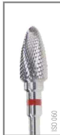
REF RIF060G 12,85 EUR