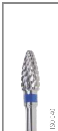
REF RIC040G 12,85 EUR