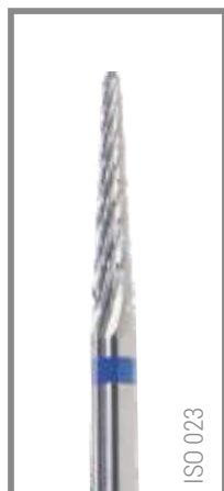
REF RIC023L 8,35 EUR