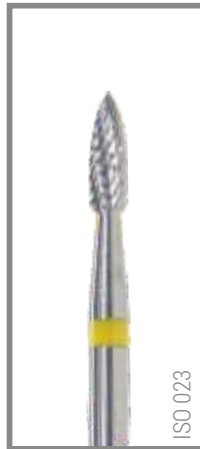
REF RIS023G 9,95 EUR