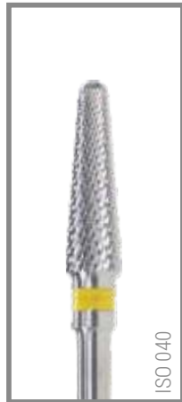
REF RIS040L 13,85 EUR

Für alle Legierungen und Komposite. Auch für Keramik. For all alloys and composites. Also for ceramic.