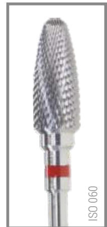
REF RIF060F 15,95 EUR