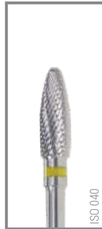
REF RIS040F 12,85 EUR