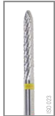
REF RIS023Q 11,55 EUR