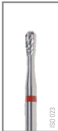
REF RIF023P 8,40 EUR