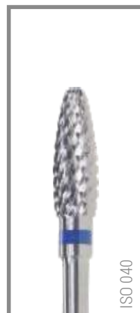
REF RIC040F 13,95 EUR