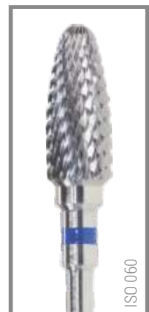
REF RIC060F 13,95 EUR