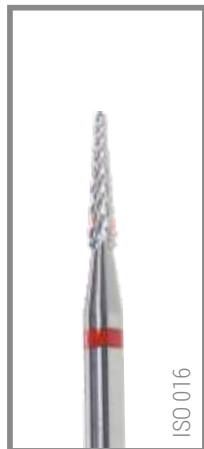
REF RIF016L 8,40 EUR

Glättet Oberflächen und ermöglicht präzises Ausarbeiten von Objekten. Smooths surfaces and enables the precise shaping of objects.